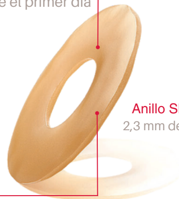
Anillo Slim 2,3 mm de espesor

Los anillos planos son accesorios versátiles diseñados para potenciar el ajuste de la lámina, protegiendo la piel periestomal e incrementando el tiempo de uso.